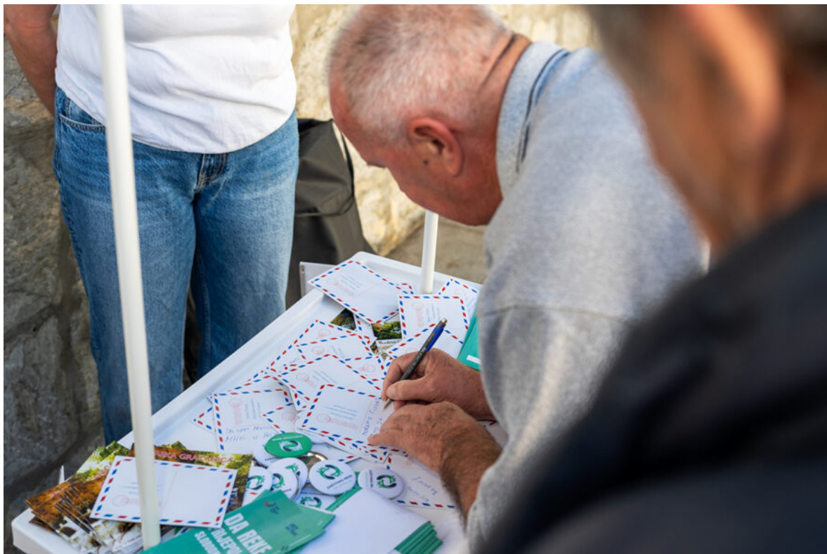
извор: НГ Заштитимо реке Пријепоља

Више о овој организацији прочитајте на линку .